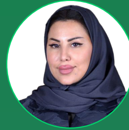
نوره فهد الجبالي نائب رئيس المجلس